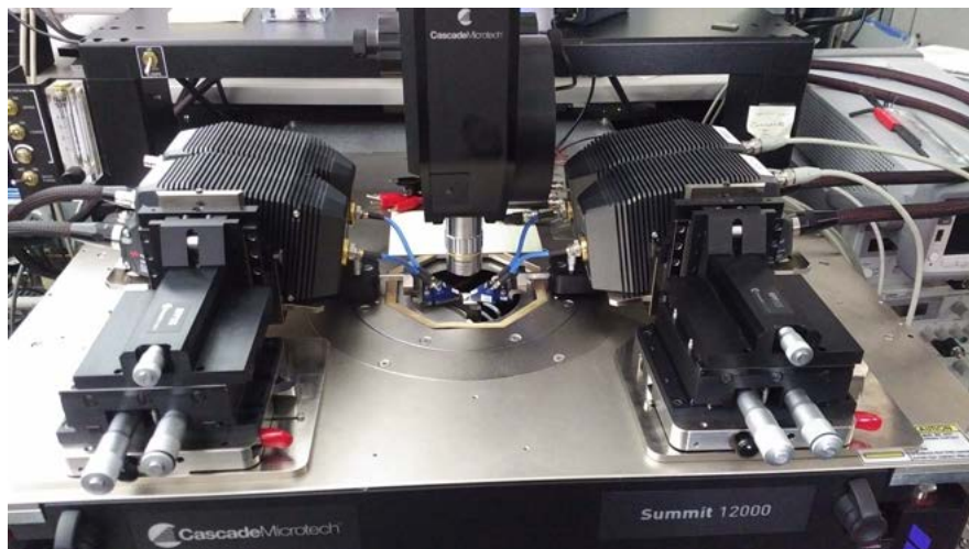
Рисунок 2. Данная конфигурация на основе четырехпортового ВАЦ N5291A и зондовой станции используется для измерений параметров дифференциального усилителя, выполненного на подложке.

Для гарантии получения точных и повторяемых результатов измерений на подложках ВАЦ N5290/91A совместимы с решениями для измерений на подложках (WMS) компании Keysight и ее партнера компании FormFactor (рисунок 2). Данные решения включают зондовые станции, пробники с подачей смещения по постоянному току и средства калибровки компании FormFactor, а также вспомогательное оборудование и программное обеспечение (ПО) компании Keysight. Возможности, предоставляемые нашими ВАЦ в совокупности с решениями для измерений на подложках, позволяют выполнять точные и повторяемые измерения при решении множества прикладных задач: моделирование устройств, совершенствование технологий, разработка и исследования характеристик производственных процессов, их мониторинг, исследования характеристик различных устройств и опытных образцов продукции.