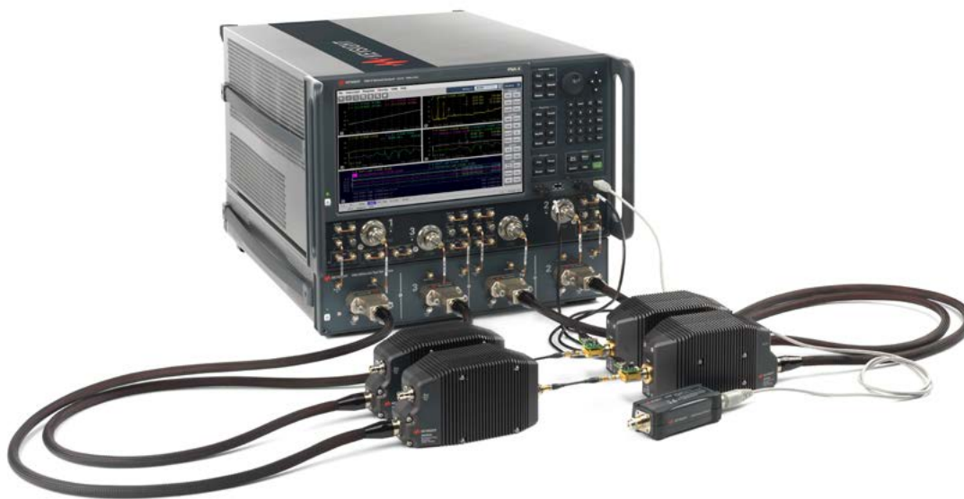
Рисунок 1. Четырехпортовый широкодиапазонный векторный анализатор цепей миллиметрового диапазона длин волн позволяет измерять характеристики самых передовых разработок с высочайшей точностью.

Наши решения для проектирования, моделирования и испытаний устройств в гигагерцовом и терагерцовом диапазонах позволят вам выводить на рынок действительно передовые и конкурентоспособные устройства. Наша последняя разработка – векторные анализаторы цепей (ВАЦ) миллиметрового диапазона длин волн N5290A серии PNA и N5291A серии PNA-X. Эти решения помогут вам добиться непревзойденного качества измерений и разработок на частотах до 120 ГГц (рисунок 1).